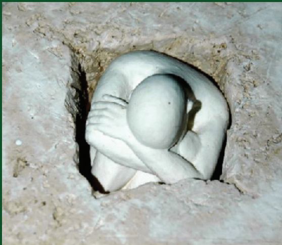
באדיבות הפסלת דלית טיאר

Challenging behaviours in the early years